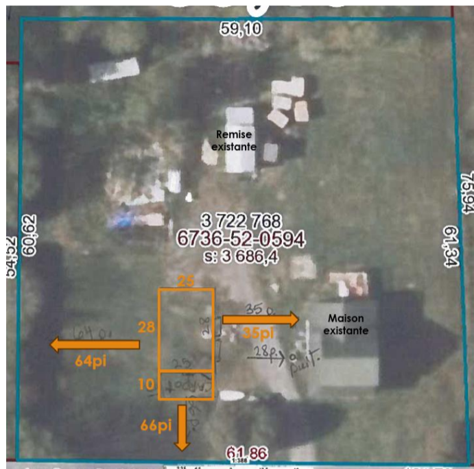
Extrait annoté du plan de localisation préparé par le demandeur, en date du 6 octobre 2025

ATTENDU QUE la configuration du lot ainsi que l'implantation du garage sont illustrées à l'extrait annoté du plan de localisation préparé par le demandeur, en date du 6 octobre 2025;