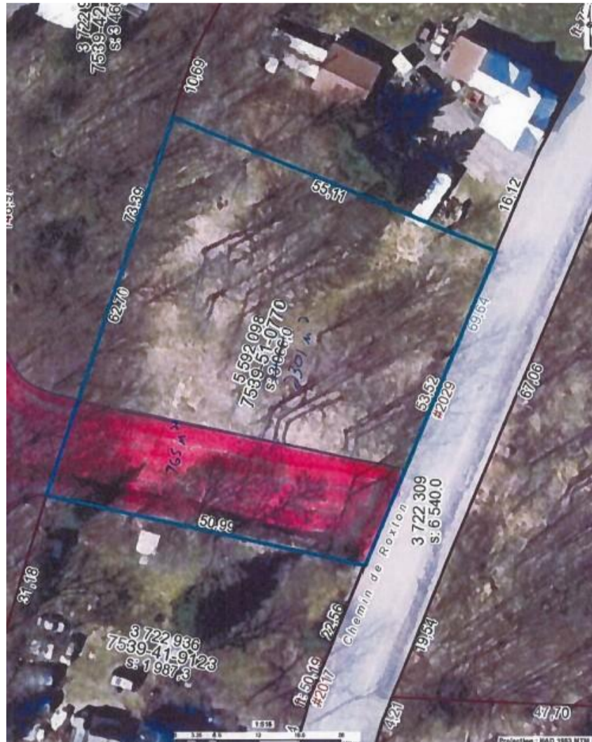
Extrait annoté par la Municipalité de Roxton Pond d'une image du site GoNet Azimut

ATTENDU QUE la projection de la future route peut être constatée ci-dessous sur l'extrait annoté par la Municipalité de Roxton Pond d'une image provenant du site GoNet Azimut :