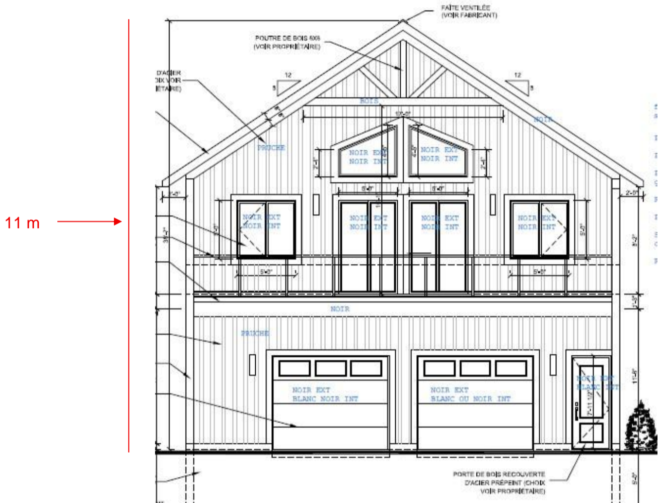
Plan de l'élévation avant dessiné par M. David Deslandes, technicien en architecture

ATTENDU QUE les membres du comité consultatif d'urbanisme ont évalué la nature de cette demande sur la base de l'article 23 du Règlement sur les dérogations mineures numéro 22-14 ;