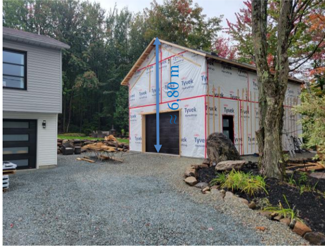
Photo annotée et reçue par le demandeur, le 28 septembre 2022

La hauteur du bâtiment peut être constatée ci-dessous, sur la photo annotée et reçue par le demandeur, le 28 septembre 2022.