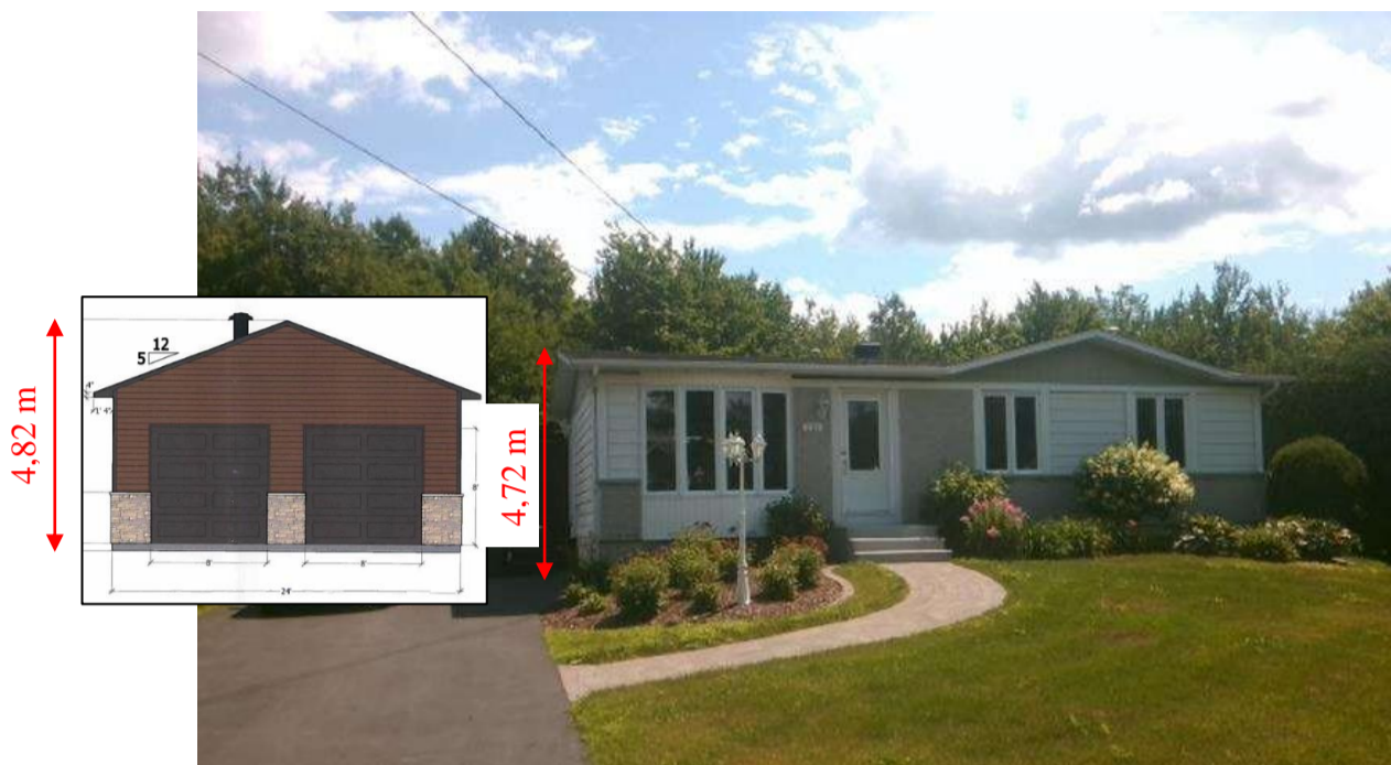
Extrait des plans de construction du bâtiment accessoire reçus par le demandeur le 14 septembre 2020 ainsi qu'une photo de la façade avant du bâtiment principal

ATTENDU QUE la présente demande est étudiée en vertu du Règlement sur les dérogations mineures n° 22-14, car elle déroge à une norme de zonage;